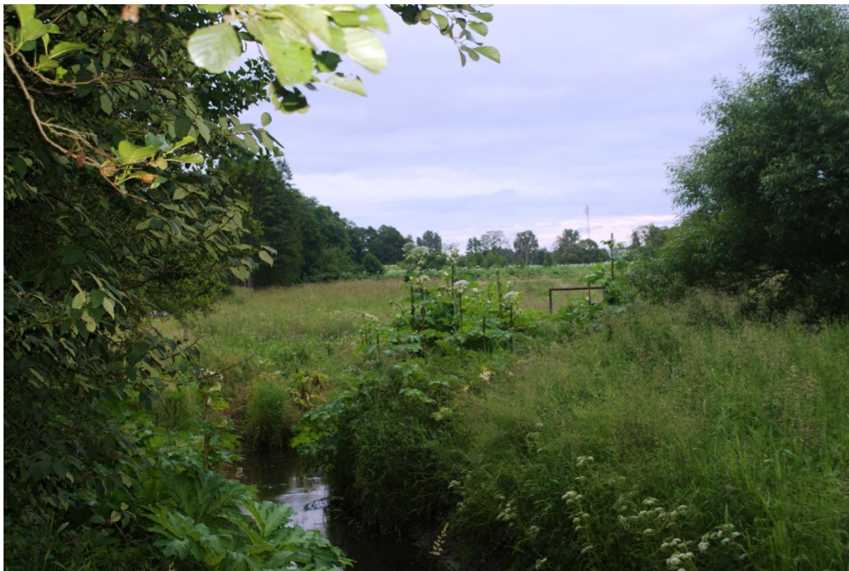
Rozprzestrzenianie wzdłuż rzeki Mienia (most wschodni w Wiciejowie)

Gatunek ten przemieszcza się rzeką Mienią (wzdłuż rzeki występują pojedyncze osobniki z rozwiniętymi kwiatostanami, jak również skupiska do ok. 30 kwiatostanów (ostatni zanotowany osobnik na granicy zachodniej części gminy przy rzece - przy działce nr 87 Wiciejów). Pojedyncze osobniki wkraczają na działki położone wzdłuż rzeki.